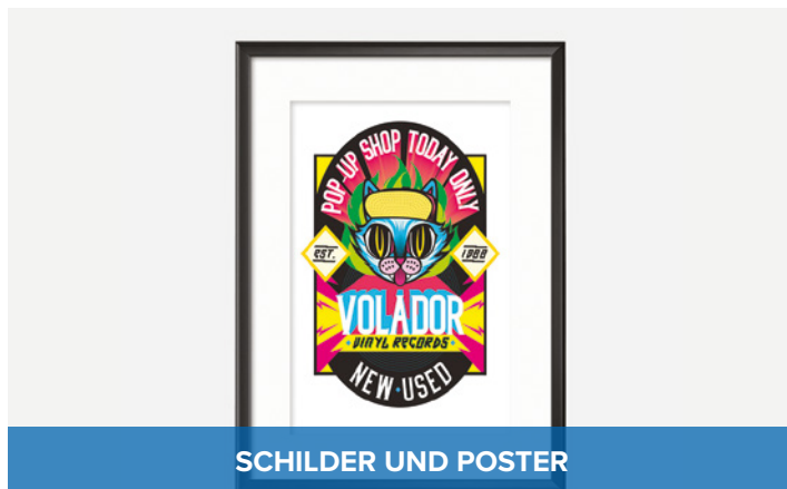
SCHILDER UND POSTER