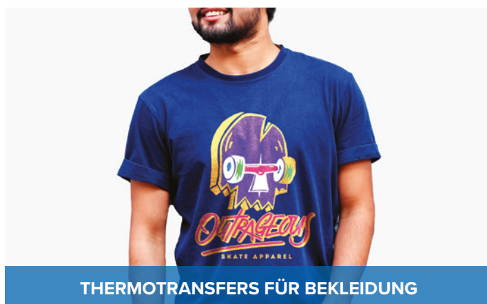
THERMOTRANSFERS FÜR BEKLEIDUNG